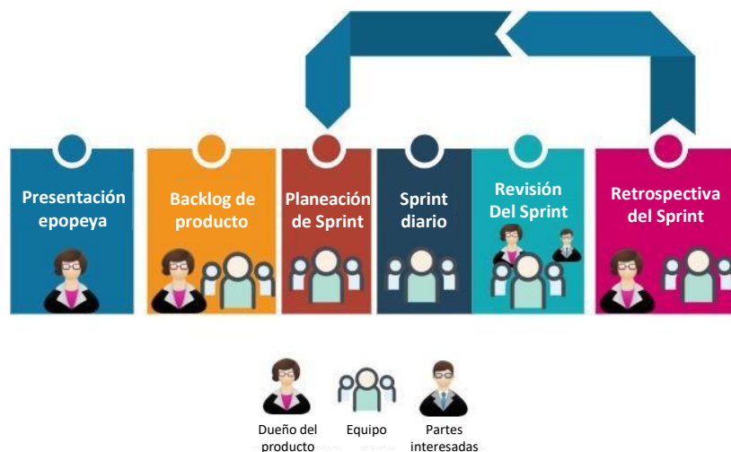
Figura 2. Eventos y roles de Scrum involucrados en cada uno

La Figura 2 muestra los eventos de Scrum, detallando los roles que están involucrados en cada uno.