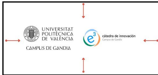
Figura 4. Final de un multimedia basado en vídeo.